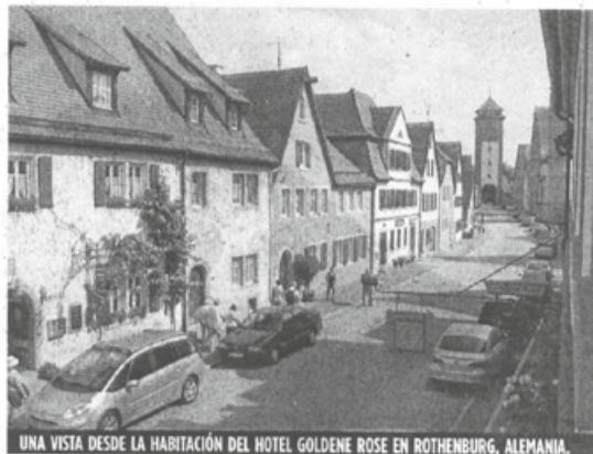
UNA VISTA DESDE LA HABITACIÓN DEL HOTEL GOLDENE ROSE EN ROTHENBURG, ALEMANIA.

(Mes de las Comidas Mágicas), de Visit Orlando. Celebrando su octavo año, este evento cuenta con más de 60 restaurantes y varios paquetes que combinan comida para dos personas con una noche de estancia en un hotel. Los restaurantes con chefs célebres son el Emeril's Orlando; Emeril's Tchoup Chop; La Luce by Dona Scala; Roy's Hawaiian Fusion y Todd English Bluezoo. Los nuevos participantes son Bohemian Bar and Grill; Kovbe Japanese Steakhouse; Michells Fish Market; Ruth's Chris Steak house (3 locales) y Siro Urban Italian Kitchen. Visit Orlando también ofrece a los turistas una forma sencilla de ampliar sus ahorros y diversión con los nuevos paquetes Magical Nights, ó (Noches Mágicas), que incluyen los hoteles: Bohemian Hotel Celebration, habitación estándar y cena para dos en el Bohemian Bar & Grill, a partir de $219 por noche; Caribe Royale, suite estándar double queen , con servicio gratuito de valet y cena para dos en The Venetian Room a partir de $155 por noche; Hilton Orlando, habitación de lujo